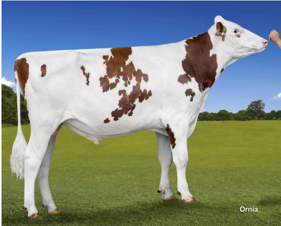
GUCCI P RED