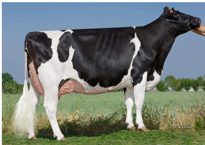
ZANI SILVER AMBRA ET (VG-86) Abuela de GUCCI P RED