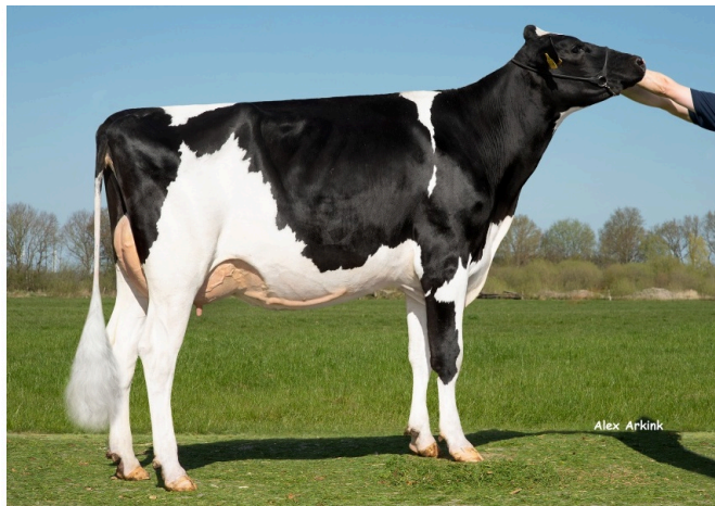
ANNE (VG-86) Hermana completa de GUCCI P RED