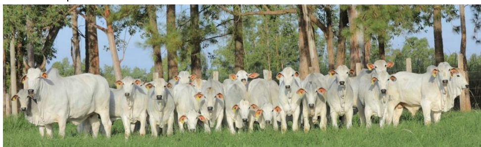
3536 BENFICA KA – MÃE JARGON / FILHOS DE JARGON KA

Criador / Proprietário: KATAYAMA ALIMENTOS LTDA REG. Nº: KAPM 3840 • Nasc.: 10/09/2013