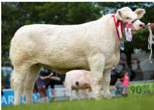
Filha FERNY, Sportsman Ladyship