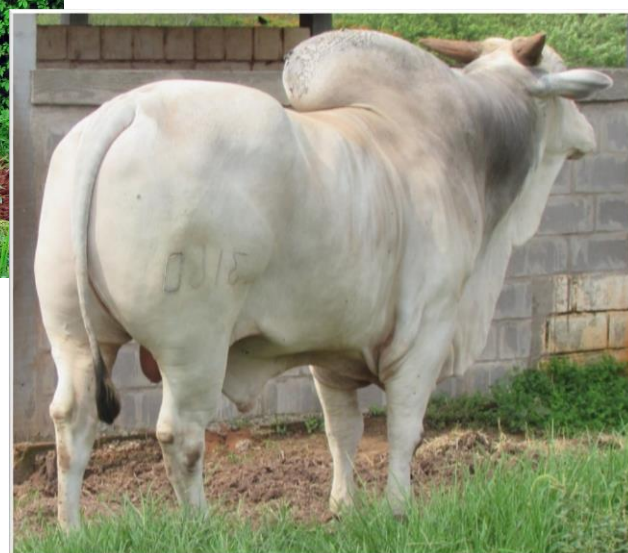
Registro nº IZSN A3160 - Nacimiento 08/10/2012