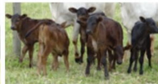
Progénie cruzamento industrial no MS