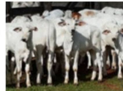
Progenie no MS