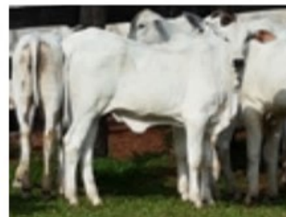
Progenie no MS