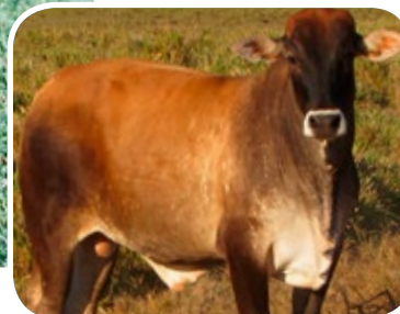
Progênie cruzamento industrial no MS

Peso ao Nascer: 47 kg Peso 205 dias: 335 kg Peso 365 dias: 525 kg Comprimento: 190 cm Altura: 147 cm Perímetro Torácico: 235 cm Comp. Bacia: 75 cm Largura de Bacia: 83 cm CE: 43 cm