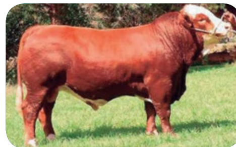
EXCALIBUR - Irmão