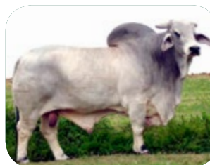
JDH AMOS MANSO - Pai