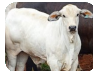
Progenie cruzamento industrial no MS